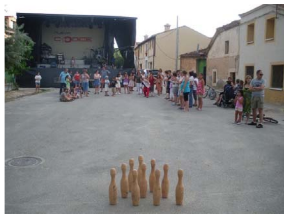
Competición de bolos femenino

Ya al comenzar el baile se realiza un pase de disfraces, en el que todos los participantes tienen un obsequio.