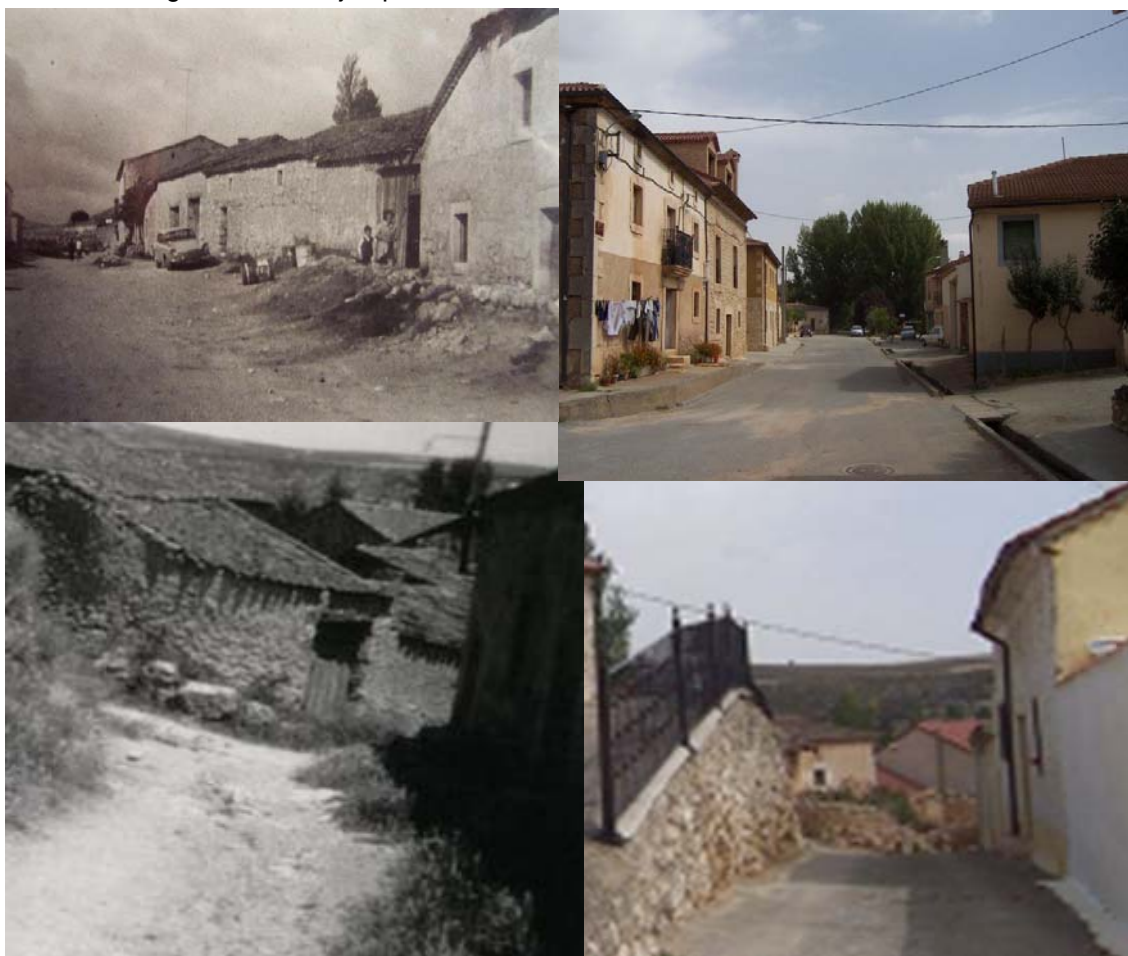
Las mismas calles en los años 80 y actualmente