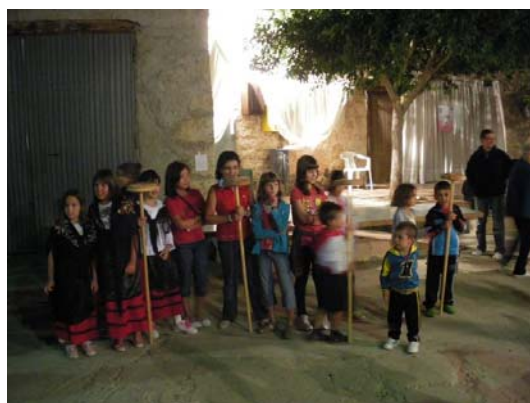
Baile de las tortas

El viernes por la tarde, víspera de Fiesta, se comienza con unos juegos infantiles y unas buenas sesiones de castillos hinchables; ya por la noche se hace una chocolatada y el baile de las tortas donde varias mujeres y niñas se visten con trajes regionales.