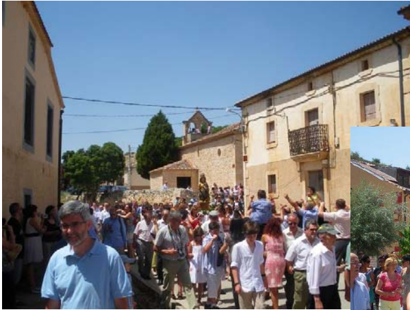
Dos tomas diferentes de la procesión bailándole a la Virgen.

El domingo es el día grande, Misa, procesión, remate de palos y rosquillas y después un buen aperitivo amenizado con música antes de comer el típico asado segoviano.