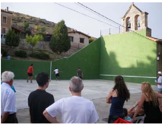
Competición de frontenis