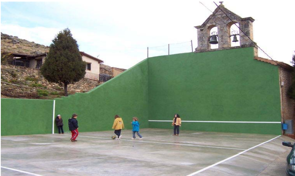
Vista del frontón después de la última reforma; ésta realizada con fondos de la Asociación.