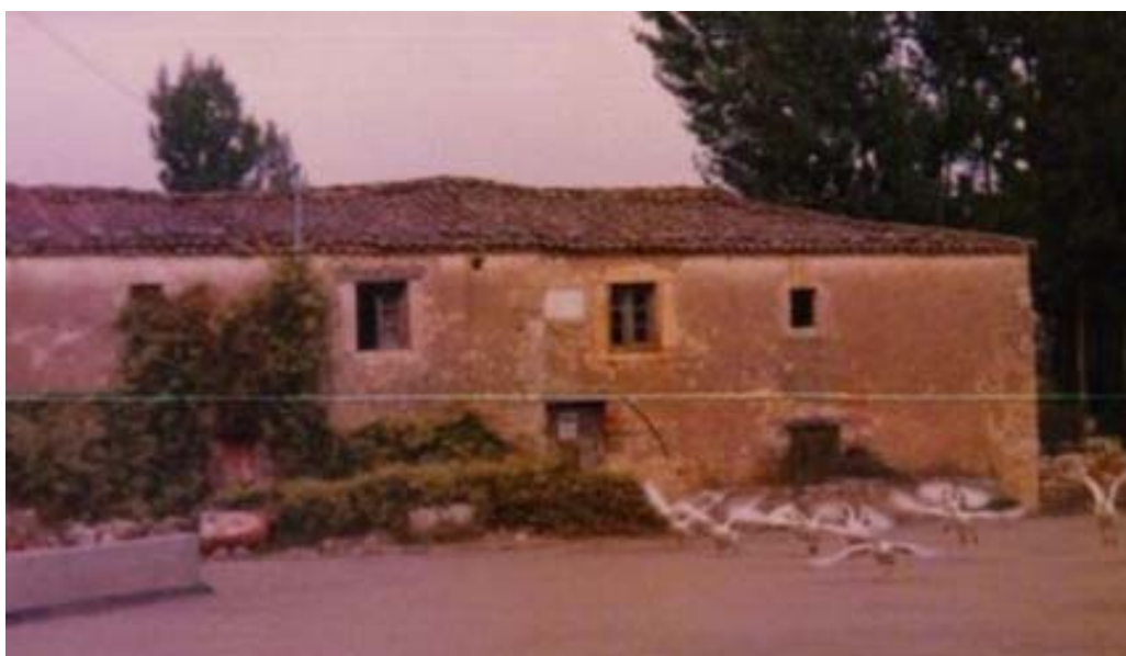
Antiguo Ayuntamiento, fragua y casa del vaquero.

Casi todos coincidimos en que es una de las mejores obras realizadas en Alconadilla. Ésta se lleva acabo con una subvención de Cultura, la venta de las antiguas escuelas (esto lo donó el Ayuntamiento) y como no podía ser de otra forma, con fondos de la Asociación.