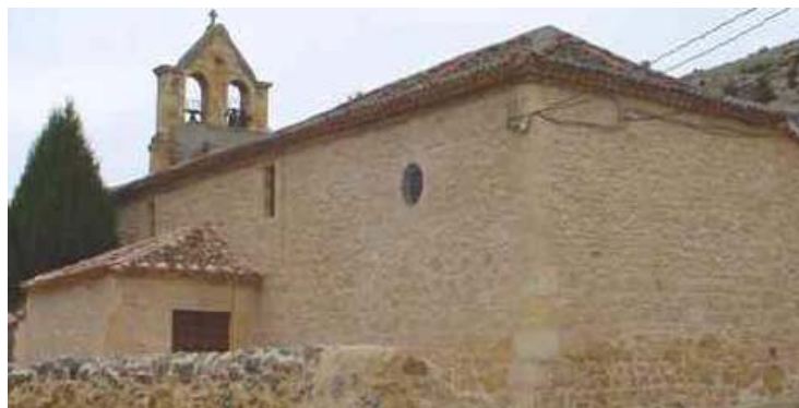
Iglesia después de la reforma

Es cierto que el tejado necesita una buena reforma, pero para esa obra se necesitaría unas subvenciones muy importantes.