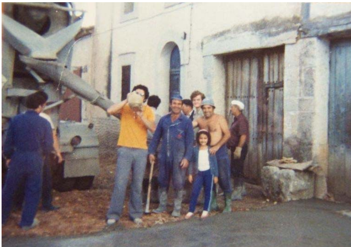
Parque infantil y frontón

Esta es una muestra de cómo se realizaron muchas obras en Alconadilla.