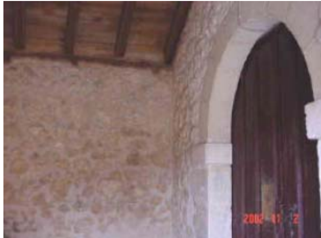
Vista del Pórtico interiormente