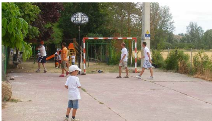
Vista del parque infantil.

Con una subvención y con aportación de la Asociación se realizó las obras de construcción de un parque infantil y la restauración del frontón, ya que en aquella época se jugaba casi sin pared y en tierra. En el año 2009 se ha tenido que reparar la pared y el suelo del frontón ya que estaba de nuevo muy deteriorado.