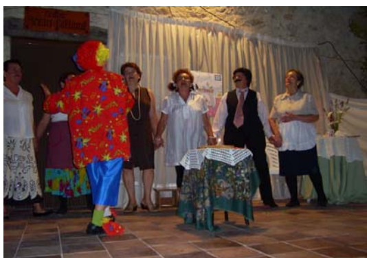
Teatro de las mujeres

Más tarde las mujeres nos amenizan con una obra de teatro de su propia cosecha.