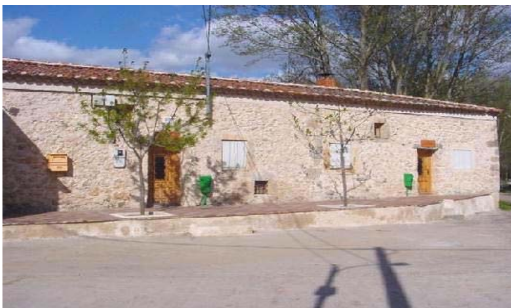
Actual Centro Socio Cultural y Centro Médico