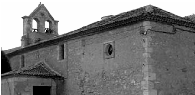
Iglesia antes de la reforma

Es cierto que el tejado necesita una buena reforma, pero para esa obra se necesitaría unas subvenciones muy importantes.